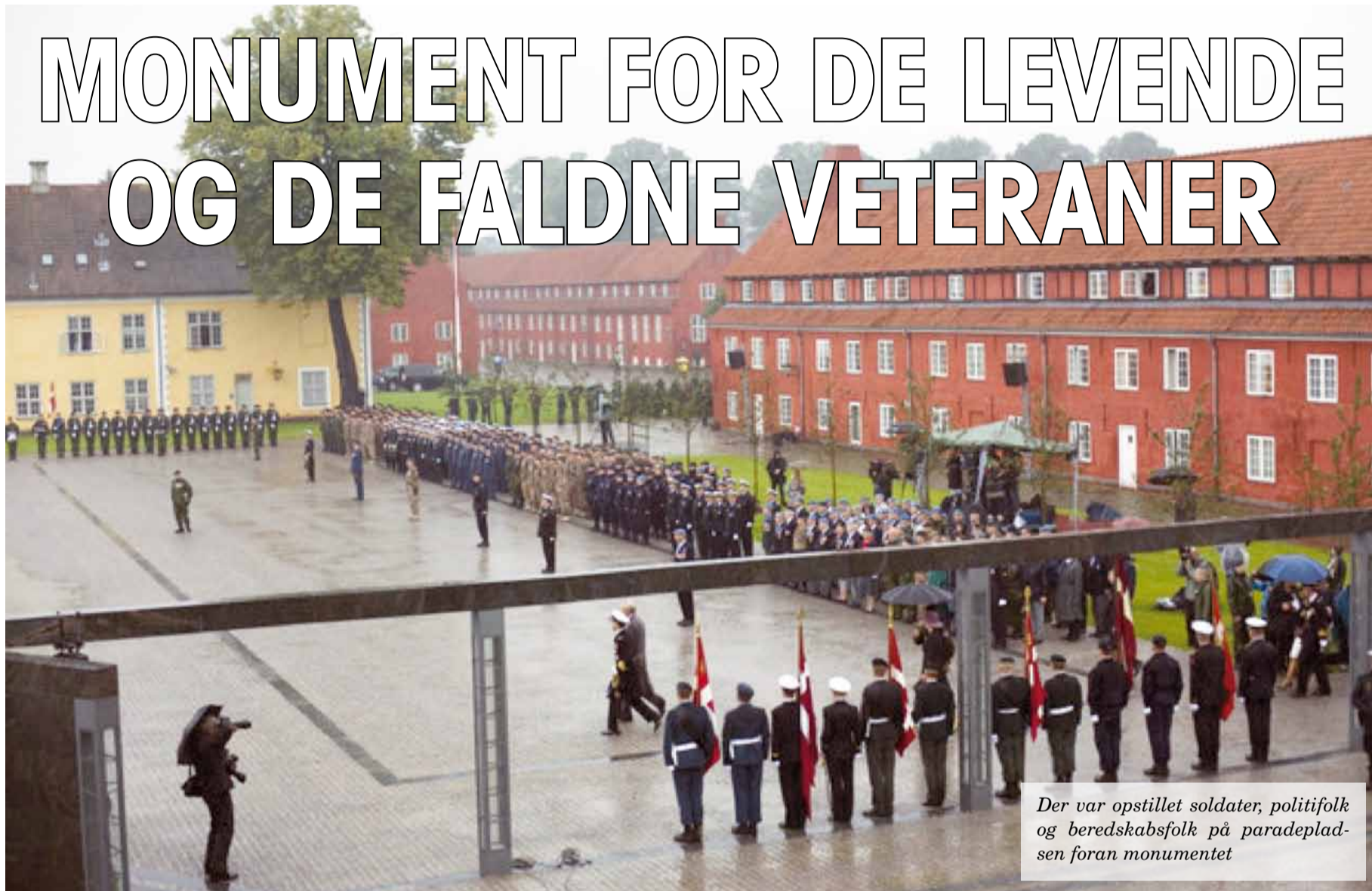
Der var opstillet soldater, politifolk og beredskabsfolk på paradepladsen foran monumentet