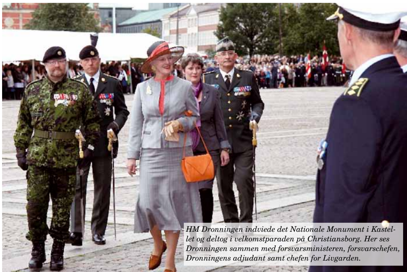
HM Dronningen indviede det Nationale Monument i Kastellet og deltog i velkomstparaden på Christiansborg. Her ses Dronningen sammen med forsvarsministeren, forsvarschefen, Dronningens adjutant samt chefen for Livgarden.